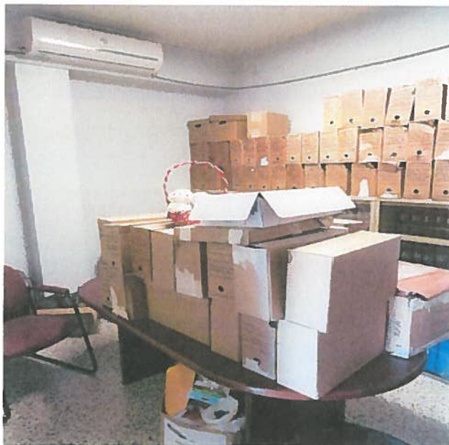
Cuarto de Abogados (24); relocalizar unidad a pared del frente.